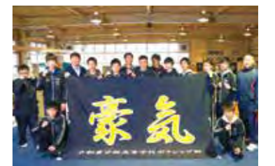
京都廣学館高等学校ボクシング部の皆さん