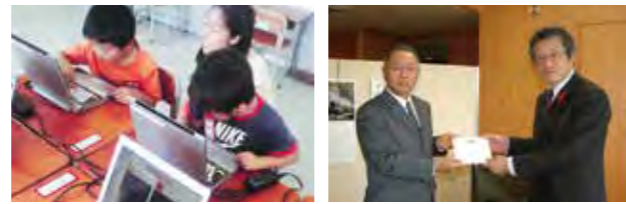
被災児童の学習支援のため中古ノートパソコンを 台風12号被災地域への義援金贈呈(奈良県) 寄贈(宮城県)

業を行い、喜んでいただきました。また、大津波に見舞われた仙台市立の小学校(中野小学校、東六郷小学校)の児童に対して、中古ノートパソコンを寄贈させていただきました。高齢化と少子化が大きな社会問題となっているなか、次世代を担う子どもたちの健全な育成が企業にとって重要な課題と考え、大阪府下に設置されている児童養護施設にも支援活動を行っています。