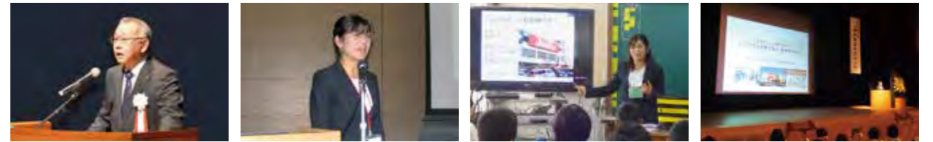
製品安全総点検セミナー(東京都) 流通事業者向け 製品安全セミナー(大阪府) 製品安全教育モデル授業(大阪府) 消費者向け製品安全セミナー(愛知県)

地である大阪府の『地域貢献企業バンク』や大阪・岬町の『岬“ゆめ・みらい”サポート事業制度』にも登録しております。今後もこれらの事業活動を通して製品安全対策の拡充と、安心・安全社会の構築に貢献してまいります。