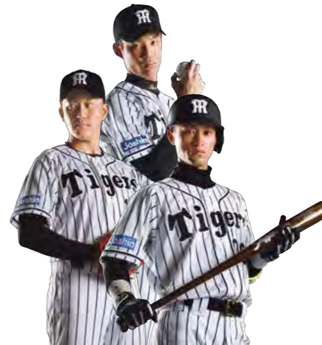
ジョーシンCMキャラクター:岩貞 祐太選手 藤浪 晋太郎選手 上本 博紀選手

ファンの皆さまのご要望にお応えして、西宮今津店・西宮ガーデンズ店・灘店・岡山岡南店の4店舗においてタイガース応援展示ブース等を展開いたしております。連日訪れるファンの皆さまの熱い視線とご好評をいただいております。