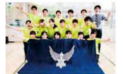
関東第一高等学校競技かるた部の皆さん

なお、掲載開始時点では関西エリアのダイレクトメールだけでしたが、平成28年6月からは、対象を東海エリア、東京エリア、北信エリア等にも拡大し、地域ごとに次世代を担う若者たちを紹介しています。次世代育成支援のため、今後も各地の「未来のチカラ」を応援してまいります。