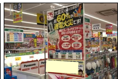
感震ブレーカーの普及啓発に協力

この他、「子ども・福祉」「雇用促進」分野で既に実施中の連携・協働事項も継続してまいります。