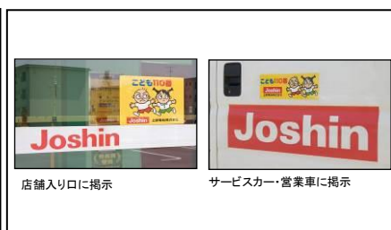
「子ども110番の家」「動く子ども110番」に登録 (府内全 63 店舗)