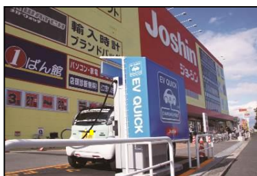
「大阪EVアクションプログラム」に参加