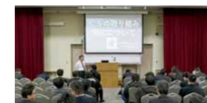
工事協力会社向け「CS研修」

※2020年3月開催予定の「新製品説明会」は、新型コロナウイルス感染拡大防止のため中止致しました。