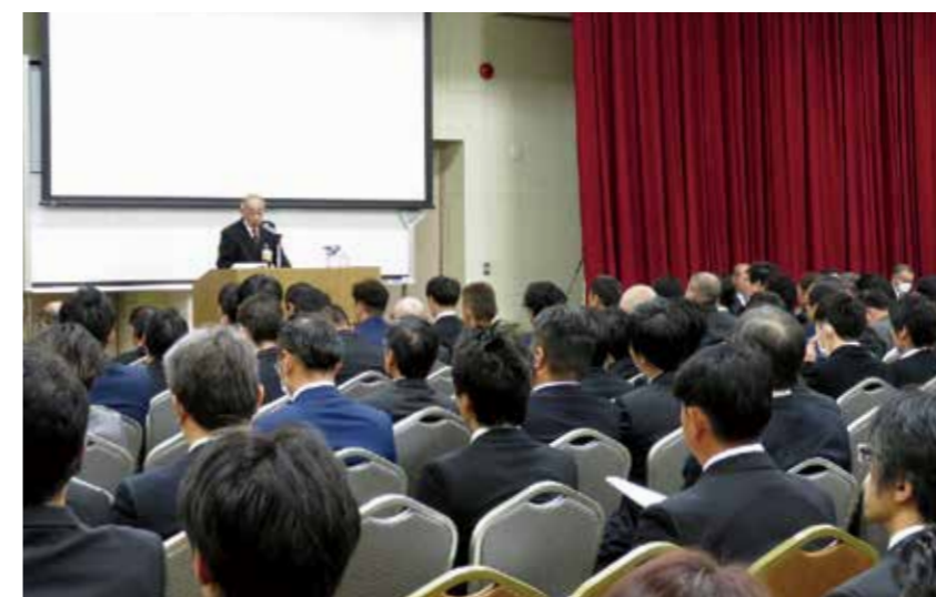
工事協力会社向け「新製品説明会」(2019年3月6日開催。参加者:224名)

への対応力を高めていただくための技術研修も定期的に行っています。また、お客さまに対するCSR活動の最重要課題として、当社のCS(顧客満足)マインドと具体的な取り組みを理解いただくために「CS研修」を順次、受講いただいております。