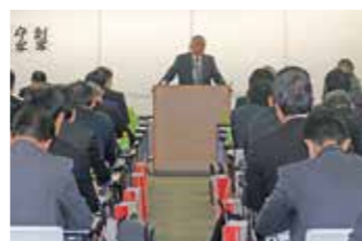
2019年11月12日実施の取引先説明会(決算説明会)(※1)

当社は毎年、中間決算後と本決算後に、取引先様を招いての取引先説明会(決算説明会)を実施しています。当社の経営にかかわる状況をご説明し、取引先様からのご質問にお答えすることで、当社の事業内容や事業戦略についてより深く知っていただくための重要なコミュニケーションの機会となっています。